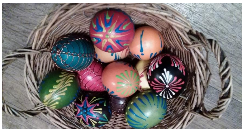
Vařená vajíčka pro koledníky