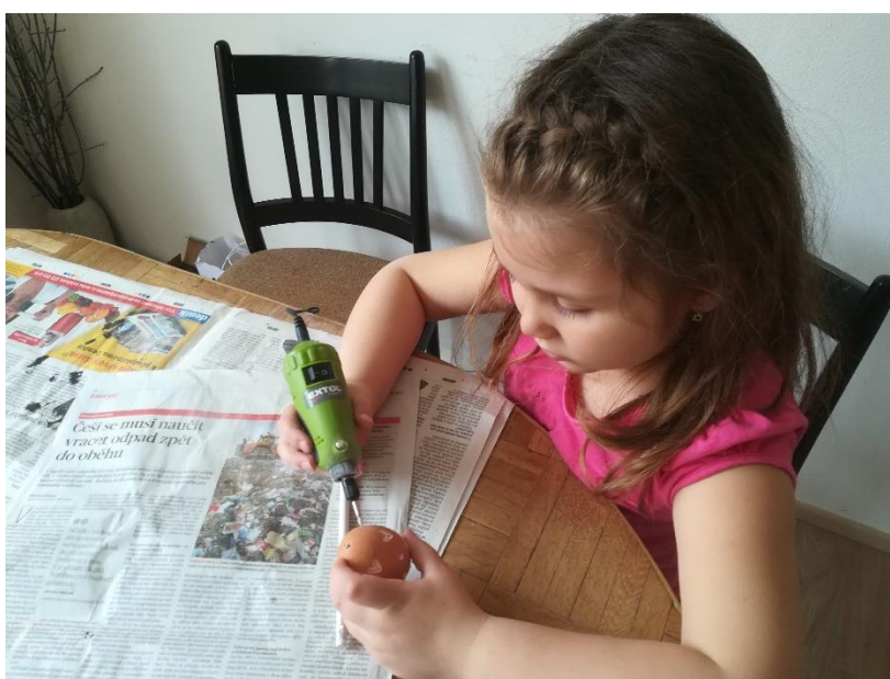
Hobby vrtačka EXTOL CRAFT (cca 460,-) zvládnou vrtat i děti od 4-5 let s pomocí rodičů