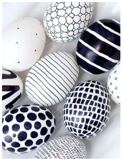
Scandi styl – černá fixa